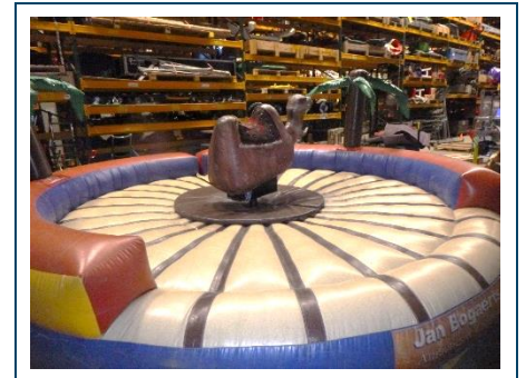
Rodeo met opzetstuk kameel