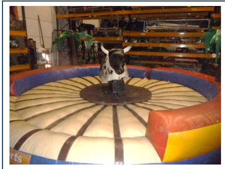
Rodeo met opzetstuk stier