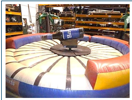
Rodeo met opzetstuk fles

Afgegeven door Materiaal Metingen Testgroep B.V., aangewezen bij ministeriële beschikking van de Minister voor Medische Zorg van 1 juli 2024 met als kenmerk 3844664-1067342-WJZ.