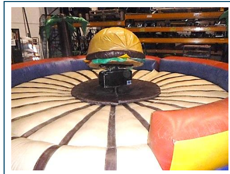
Rodeo met opzetstuk hamburger