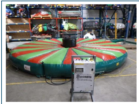
Rodeo snowboard met valkussen RV600.00.01

Afgegeven door Materiaal Metingen Testgroep B.V., aangewezen bij ministeriële beschikking van de Minister voor Medische Zorg van 1 juli 2024 met als kenmerk 3844664-1067342-WJZ.